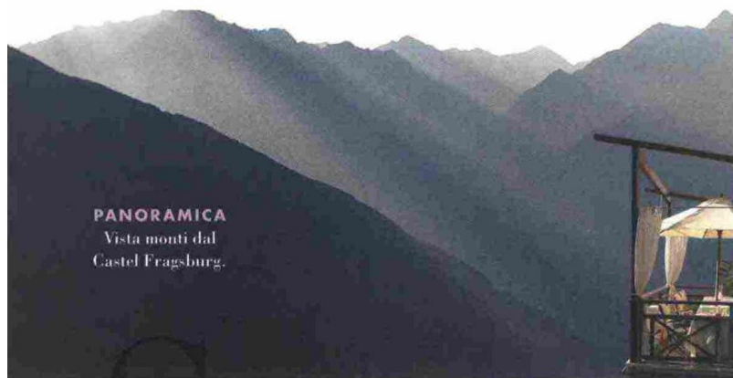
PANORAMICA Vista monti dal Castel Fragsburg.

S cegliete un panorama che amate, immaginate di guardarlo dall'alto e trasformate questa cartolina nella scenografia della festa. Ecco la nostra top ten delle terrazze più belle d'Italia. Al resto penseranno le stelle.