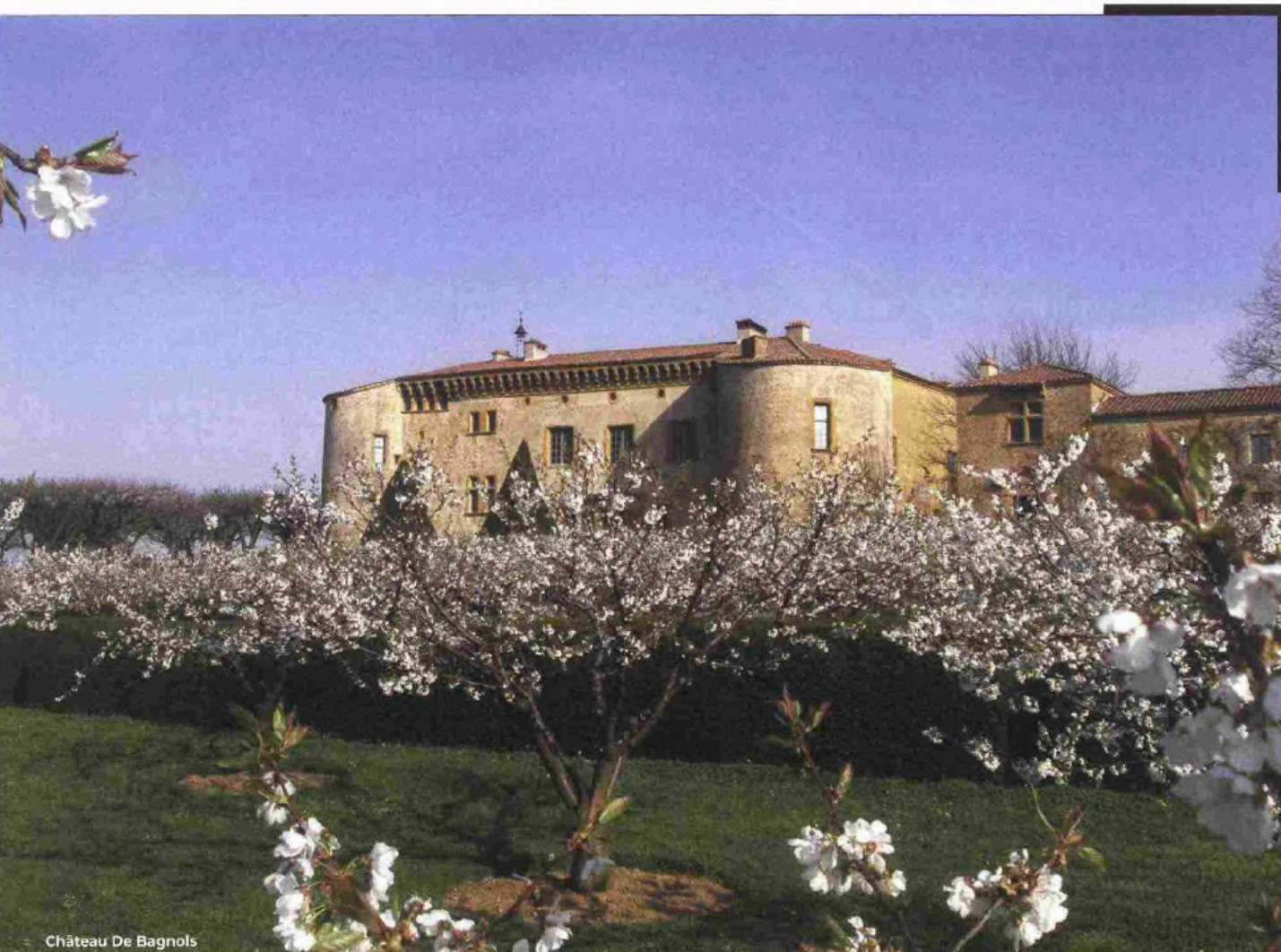
Château De Bagnols

Trascorrere del tempo in un castello significa vivere un'esperienza unica, ritrovando la magia di un'atmosfera incantata che riporta alla memoria sogni e ricordi.